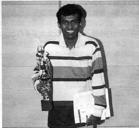
日本語の部優勝 デーワガマゲーダナシリウィジェーダーサさん