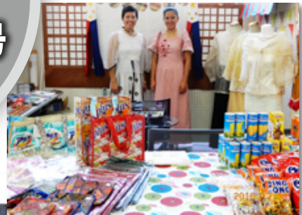
沼津高等専門学校 Numazu National College of Technology International Forum