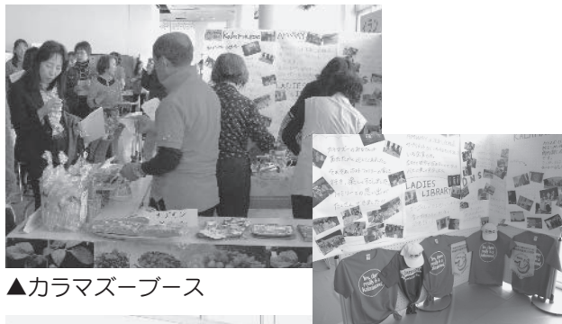
▲カラマズーブース

試食をしながら説明を聞いたり、来場者との交流を深め、情報を得ることができたようです。