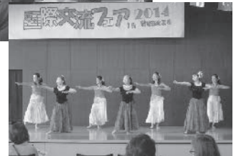
▲ハワイアンフラダンス

今年初出場のフィリピンは、キャンドルを持って踊る伝統的なダンスを披露してくれました。