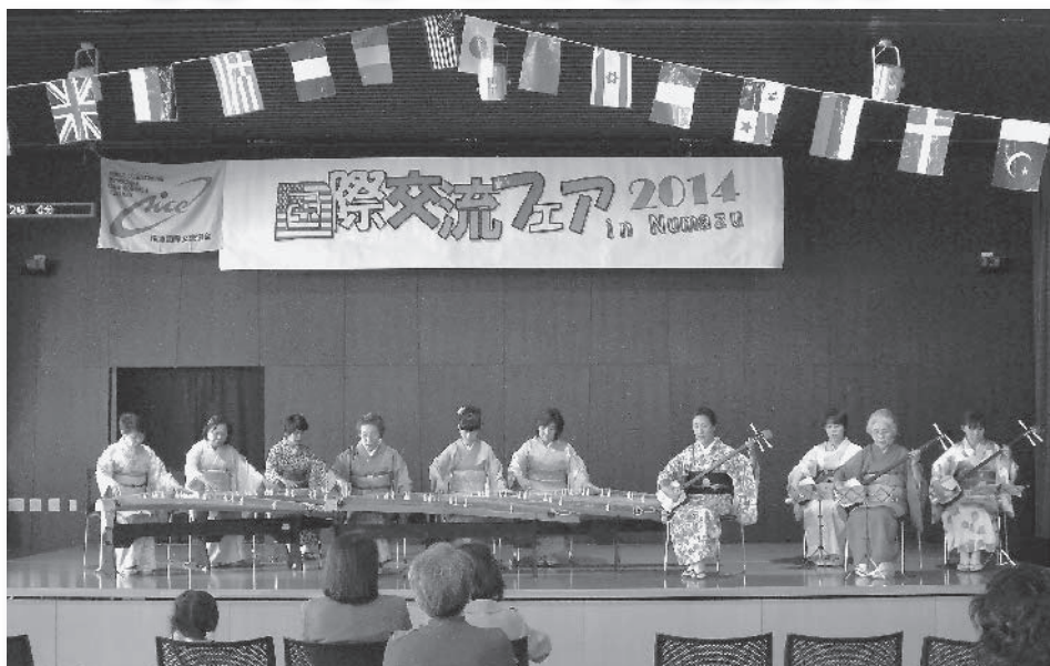
▲平成26年11月23日 国際交流フェア サンウェルぬまづにて