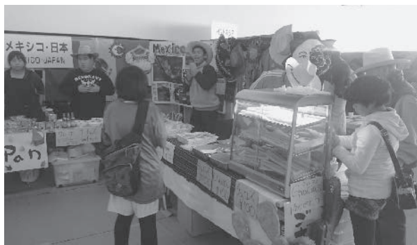
▲メキシコ・日本ブース

今年は新たにメキシコ・日本ブースが設けられ、障害者支援施設で制作された小物、野菜、パンやメキシコ発祥のチュロスの販売や、ナチョスの試食の提供がありました。朝採りのレタスはあっという間に完売しました。