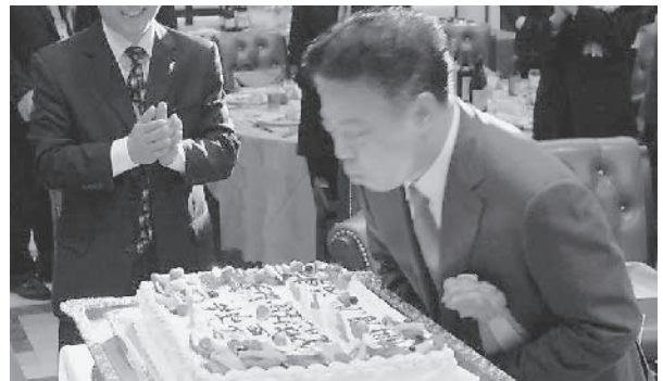
【誕生日ケーキのろうそくを吹き消す盛市長】

表敬訪問を終え、専用車で御用邸記念公園へ。東附属邸においての昼食会では栗原市長・真野議長と楽しいひと時を過ごした。昼食後は井原副市長の案内で港湾を散策、夜は熱烈歓迎会に。歓迎会には栗原市長はじめ40名の皆さんが参加され、盛大に行われた。開始間もなくサプライズ、参加者全員ハッピーバースデーの歌と共に盛市長の誕生日（10月14日）を祝い、一気に盛り上がり岳陽側面々も興奮気味、忘れられない沼津市訪問になったと思う。盛市長が各テーブルを回り挨拶される姿は、我々にとって良い印象を与えてくれた。