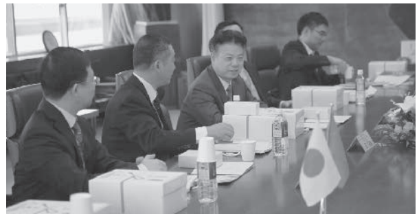
【和やかな雰囲気で行われた表敬訪問】

た。国道107号をはじめとする道路網の発達で、高速道路も北京～広州まで開通（岳陽市は中間に位置する）、三峡の入口である宜昌にも4時間程度で訪問でき、ダム見学も容易にできるようになった。世界遺産の張家界観光も岳陽市華陽県経由で専用道路を利用できる。また高速鉄道もあり、北京までは6時間強で行けるようになった。最大のプロジェクトは2017年開港予定の空港建設で、当面は国内線の多数運航を目標にしているとのこと。今後も観光都市岳陽をめざし開発に努める等々、岳陽市アピールに感心するばかり。最後に記念写真を撮影し、表敬訪問を終了した。