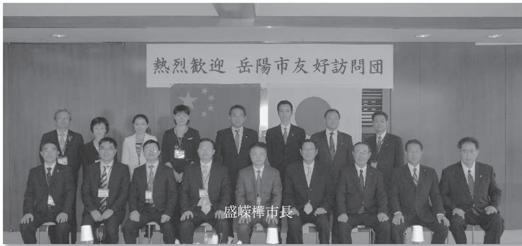
▲平成26年10月10日 岳陽市友好訪問団来沼 沼津市役所にて

発行日 2015年1月1日 発行者 NICE沼津国際交流協会 (企画広報部会) 所在地 沼津市御幸町16番1号 (事務局) 沼津市役所市民協働課内 ☎055-934-4717 FAX055-931-2606 http://www.nice-numazu.org/