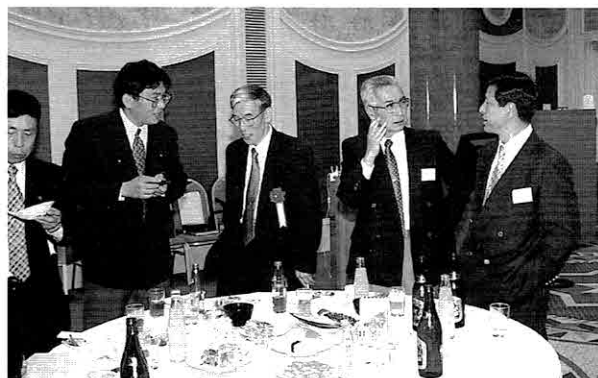
お料理はいかがでしたか??

その後は楽しいビンゴゲーム、最後の締めは道前新副会長。夕べのひととき、会員相互の親睦を目一杯深めた1日でした。