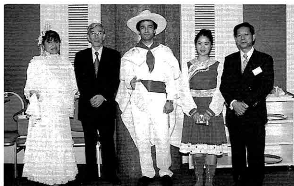
素敵な舞踊をありがとう

その後は楽しいビンゴゲーム、最後の締めは道前新副会長。夕べのひととき、会員相互の親睦を目一杯深めた1日でした。