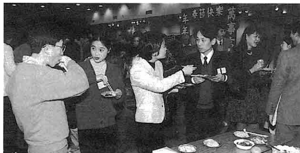
▲ 美味しい料理を囲んでの楽しい会話

今年も中国人研修生による笛の演奏のほか、お琴の演奏、生け花、日舞、岳陽書画展示、中国将棋、書道、歌、フォークダンス、餅つき、水餃子などと盛りだくさんのプログラムを楽しみました。