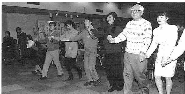
▲ 互いに手を取りあつてのフォークダンス