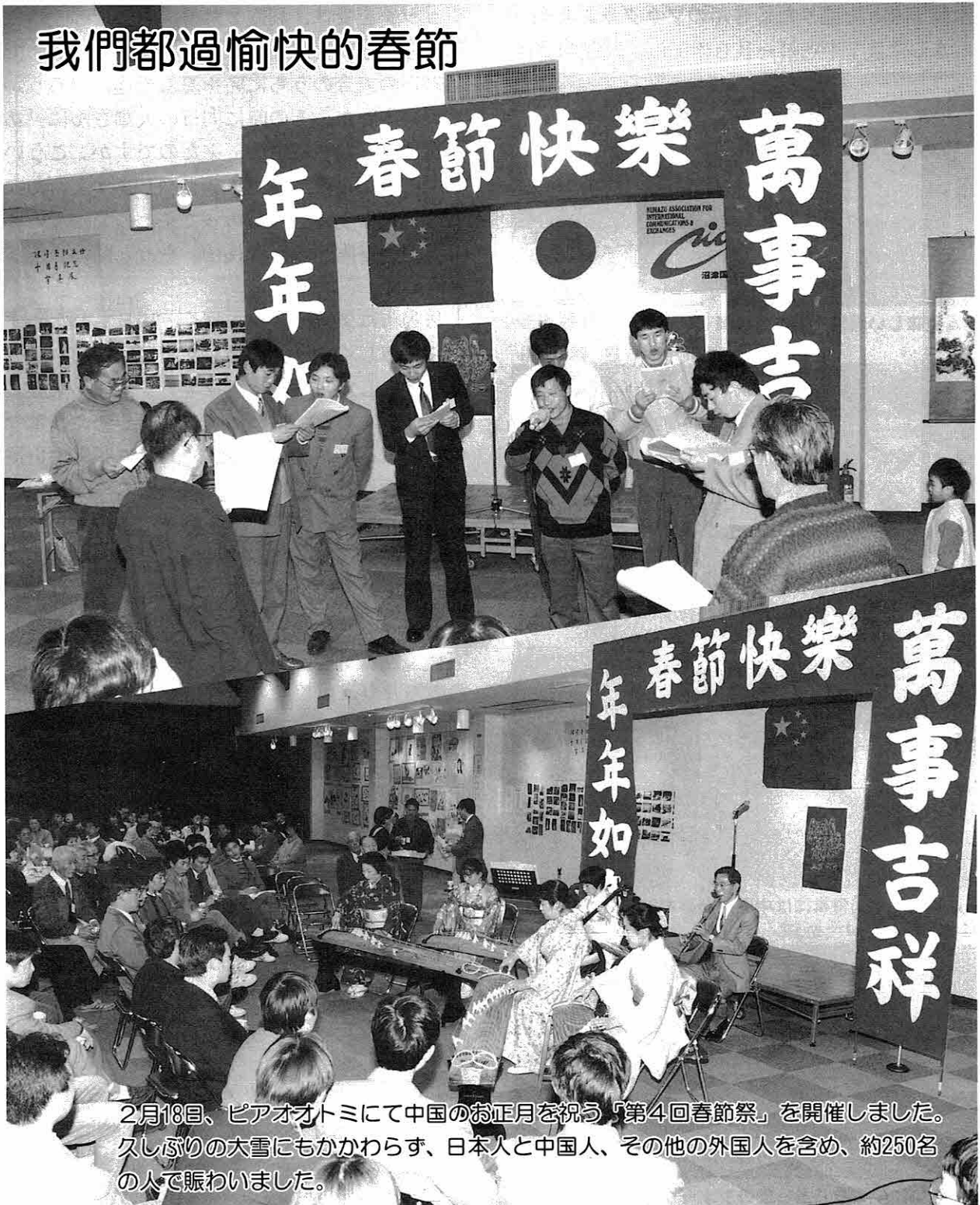
2月18日、ピアオオトミにて中国のお正月を祝う「第4回春節祭」を開催しました。久しぶりの大雪にもかかわらず、日本人と中国人、その他の外国人を含め、約250名の人で賑わいました。