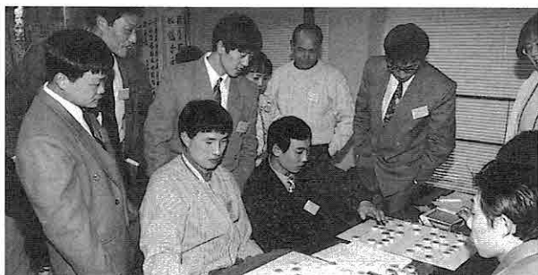
▲ やはり中国将棋には中国人が夢中に…