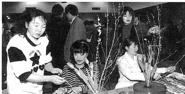
▲ 他の外国人も参加した生け花教室