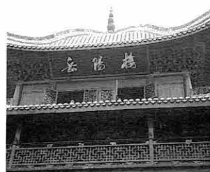
世界に名高い岳陽樓