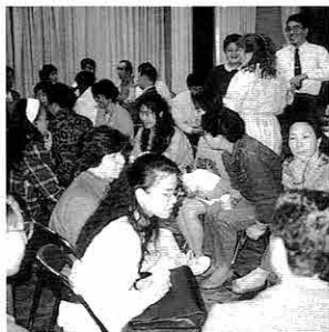
第1回国際交流サロン(5/9)