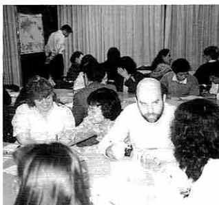
第1回日本語を語る会(5/9)