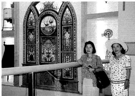
▲カラマズー・ヴァリーミュージアム

ご提供いただける方は、事務局 (☎34-2529) までご連絡下さい。よろしくお祈りします。