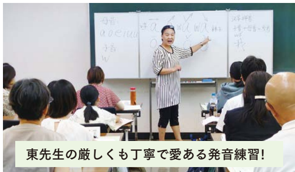
東先生の厳しくも丁寧で愛ある発音練習！

慣習、詩文、現在の状況、流行語なども教えてくれます。動画も使ってくれるので視覚的にも理解が深まり毎回受講するのが楽しいです。教室の雰囲気は和やかです。自己紹介やレストランでのやりとりといった実践的なことも受講者全員の前で発表します。緊張しますが先生に褒めて頂くと大変うれしいです。他の受講者の発音や質問を聞くのも勉強です。先生は「何でも質問してくださいね」と言ってくれるので、質問がしやすいです。今は自宅学習もしています。中華ドラマで授業で習った言葉を聞き取れた時は感動しました。私にとってこの講座は中国と中国語という新しい世界を教えてくれた貴重な学びの場です。