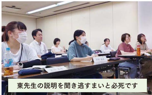
東先生の説明を聞き逃すまいと必死です