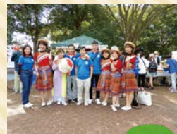
☞ 過去の国際交流フェア