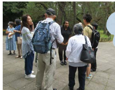
Cチーム ノーディア先生